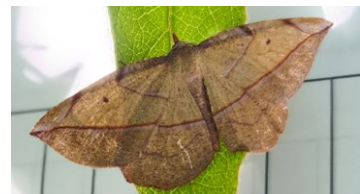
ウラモンアカエダシャク