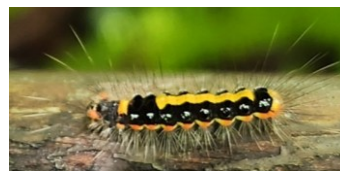
ゴマフリドクガ