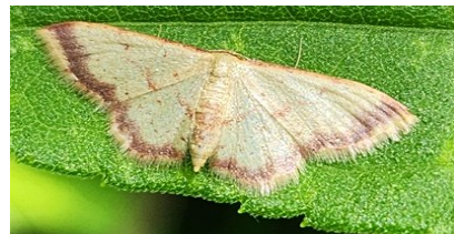
キオビベニヒメシャク