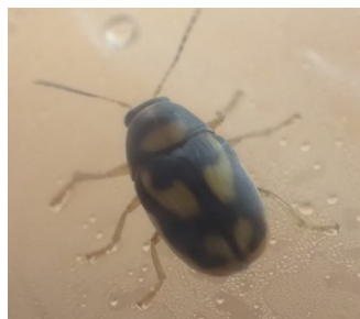
キスジツツハムシ