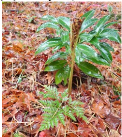
フユノハナワラビ