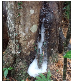
カクレミノに泡(樹幹流)