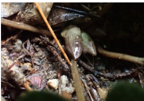
スズカカンアオイつぼみ ツノロウムシ