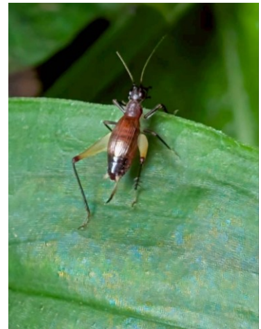
ヤマトヒバリ♀成虫