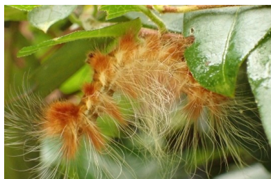
オビガ幼虫