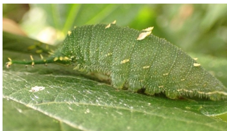
アカボシゴマダラ幼虫