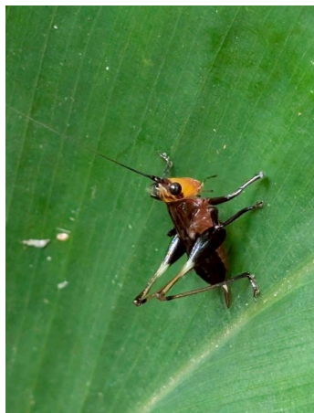
ササキリ幼虫