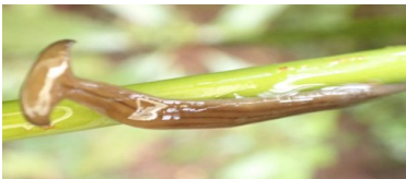
コウガイビル