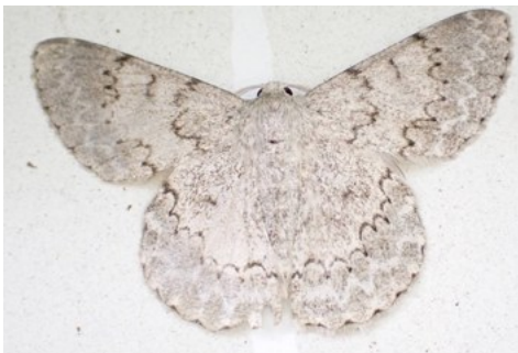
コアヤシヤク