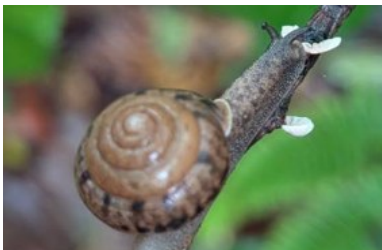
ウスカワマイマイ