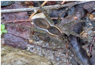
スジブトハシリグモ