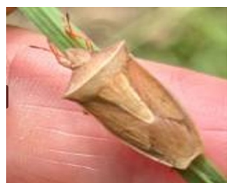
エビイロカメムシ