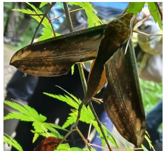
キイロスズメ