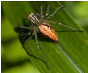
ササグモ