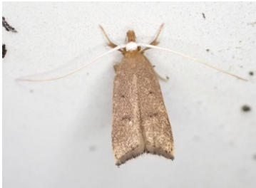
カクバネヒゲナガキバガ