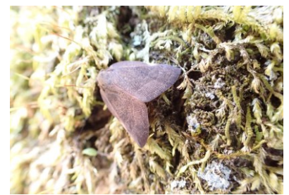
チュウゴクアミガサハゴロモ 外来種