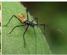
オオトビサシガメ (幼虫)