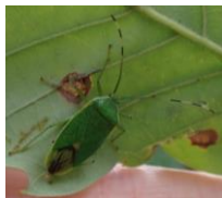
クヌギカメムシ (成虫)