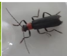
ムネアカクロジョウカイ