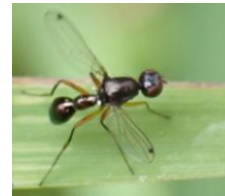
ヒトテンツヤホソバエ