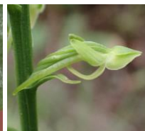
オオバノトンボソウ