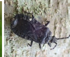
クロヒラタカメムシ