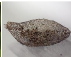
ヒメヤママユ (菌殻)