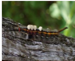
ヒメシロモンドクガ (幼虫)