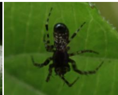
ギンメツキゴミグモ♂