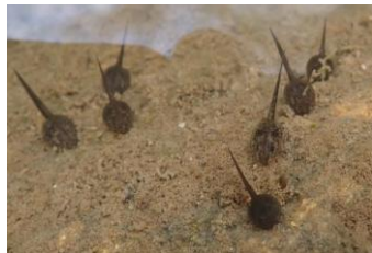
ニホンアカガエル オタマジャクシ