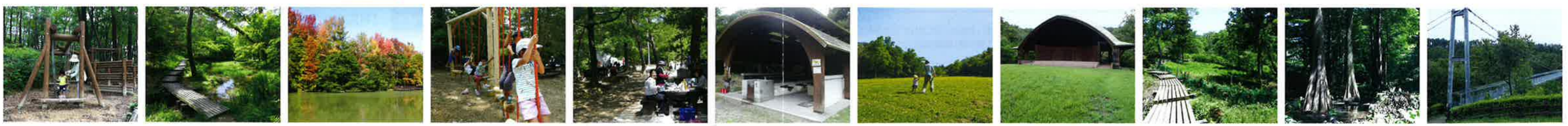
冒険の森 うくいす谷 西ノ谷奥池 かおりの広場 ピクニックガーデン 炊飯棟 スポーツ広場 イベント広場 自然観察林(三番池上流湿地) ラクウショウ谷 空の散歩道(吊り橋)