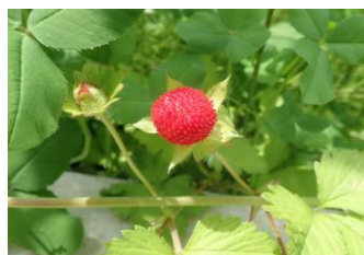
ヤブヘビイチゴ 実