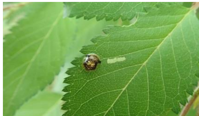
セモンジンガサハムシ