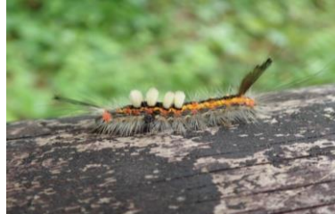
ヒメシロモンドクガ 幼虫