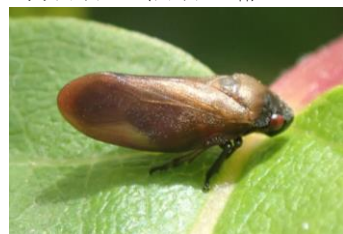
コガシラアウフキ (コガシラアウフキムシ科)