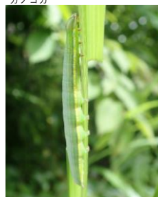
ウスキシヤチホコ (シヤチホコガ科) 幼虫