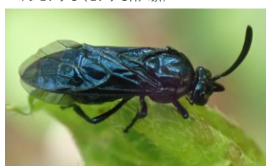
ルリチュウレンジ (ミフシハバチ科)