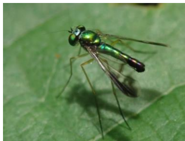
マダラアシナガバエ (アシナガバエ科) ♂