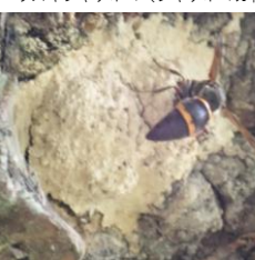
ドロバチsp (ドロバチ科)