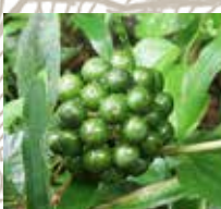
タチシオデ(未熟果)