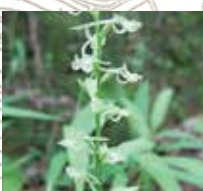
オオバノトンボソウ