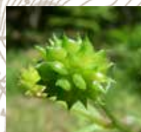
ケツネノボタン(実)