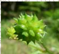
ケツネノボタン(実)