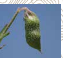
カラスノエンドウ(種)