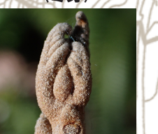
アカメガシワ(冬芽)