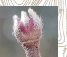
コバノガマズミ(冬芽)