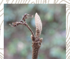
ヤブムラサキ(冬芽)