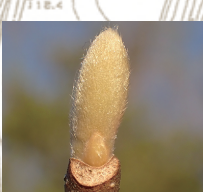
ハクモクレン(冬芽)