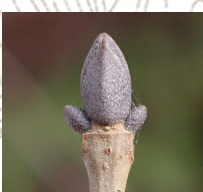
マルバアオダモ(冬芽)