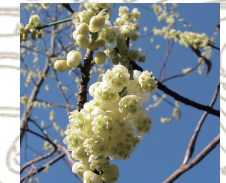
アオモジ(暖地性樹木)