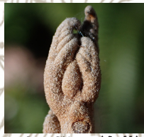
アカメガシワ(冬芽)