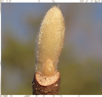
ハクモクレン(冬芽)