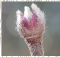
コバノガマズミ(冬芽)