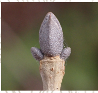
マルバアオダモ(冬芽)