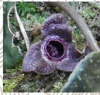
スズカカンアオイ