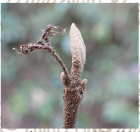
ヤブムラサキ(冬芽)