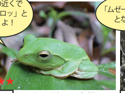
シュレーゲルアオガエル (声)