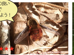
ヒロウドツリアブ