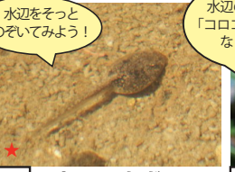
ニホンアカガエル (オタマ)