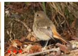
ジョウビタキ(メス)