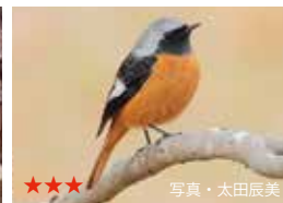
ジョウビタキ(オス)