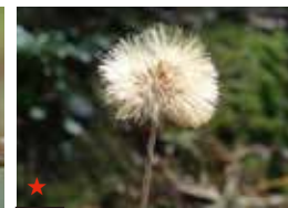
センボンヤリ(タネ)