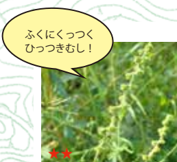
ヒメキンミスヒキ(実)