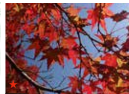
イロハモミジ(紅葉)