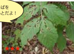
イチモンジカメノコハムシのしゅこん