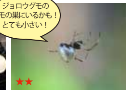
シロカネイソウウグモ