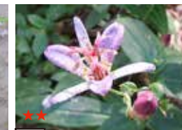
タイワンホトトギス