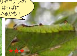
ツマジロシャチホコ (幼虫)