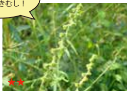
ヒメキンミズヒキ (実)