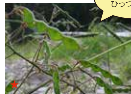
アレチヌスビトハギ (タネ)