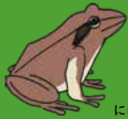
にほんあかがえる