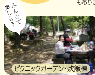
ピクニックガーデン・炊飯棟

【ピクニックガーデン・炊飯棟の料金】 小学生以上 一人200円（環境整備金） 食材や道具一式が揃った「手ぶらでBBQ」もあります（要予約）。