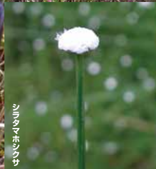
シラタマホシクサ