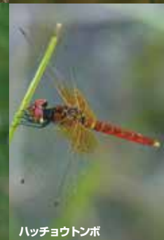
ハッチョウトンボ