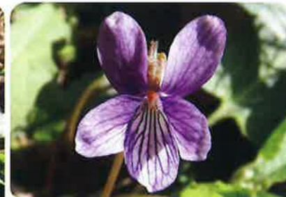
花は紫色で、花びらの濃紫色の模様がよく目立つ。花の直径は1~1.5cm