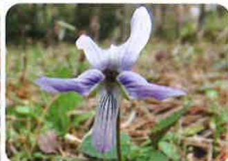
淡紫色~紫色。雌しべや雄しべの付属体(オレンジ色)がよく見える。