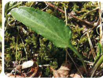
葉に短い白毛が多くはえる。葉柄にわずかに翼がある。