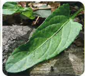
葉は長く、葉柄に翼がある。