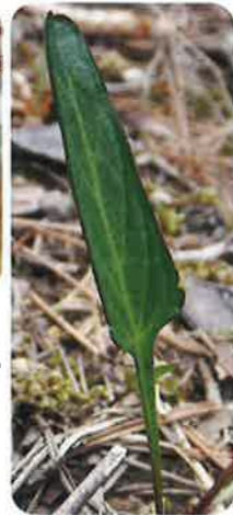
葉は長く、葉柄に翼がある。