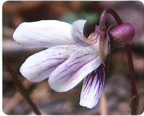
距は短く、ピンク色のものが多い。