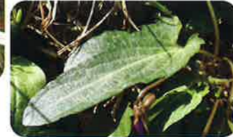
葉は長く、縁が波立つ傾向。