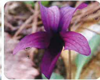
花は濃紫色で、中央部が白っぽいものもある。