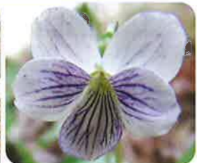
花は白色~淡紫色で、花びら全体に紫色の模様がある。