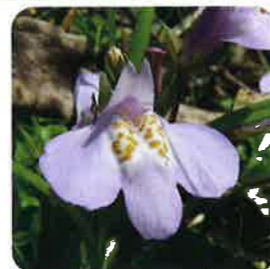
ムラサキサギゴケ