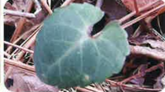
葉は卵型~広卵型で厚い。裏面は赤紫色を帯びることが多い。