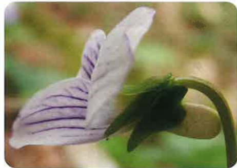
距は太くやや短い。