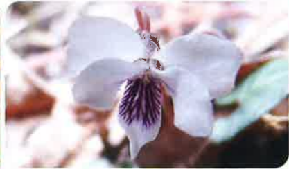
花は白色が多いが、淡紅色もある。花びらに紫色の模様が入る。花の直径は約1cm。