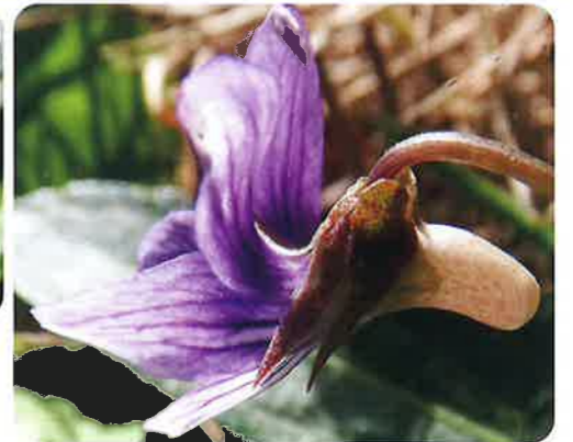
距はやや太い。萼が赤紫色を帯びることが多い。